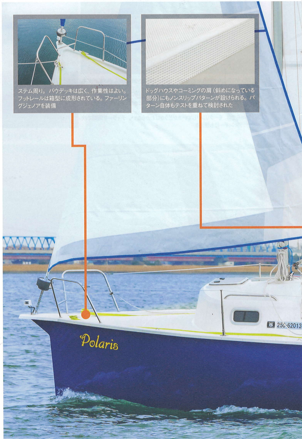
ステム周り。パウデッキは広く、作業性はよい。フットレールは箱型に成形されている。ファーリングジェノアを装備

セールプランはトラディショナルスタイルというべきか、マスト位置は前めで、長めのブームに短めのJ寸法、低めのIポイント、そして幅の狭いシュラウドベースの組み合わせだ。ジェノアは、オーバーラッ